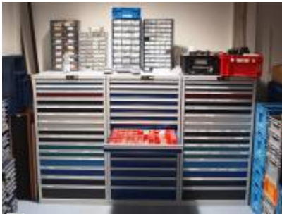
Die drei Schubladen-Schwestern